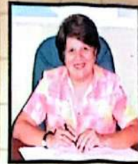
SONIA MEDINA, Gobernadora, Copán. "Los pueblos son los llamados a externar su preocupación por su situación y a participar en todas las acciones que procuran reducir la pobreza".

- Que las propuestas no sean ignoradas, sino que sean reconocidas como un esfuerzo participativo del mismo pueblo para reducir la pobreza y conducir su propio desarrollo.