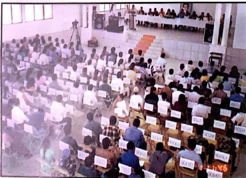
■ Cabildo Abierto, La Unión, Copán, 2003.