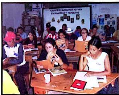
■ Capacitación Módulo #3, Ramal de El Tigre, El Progreso, Yoro.

han identificado cinco regiones a nivel del país, siendo estas: Occidente, Valle de Sula, Bajo Aguán, Centro y Sur. A la fecha se están realizando reuniones con organismos presentes en estas zonas para el montaje de asambleas.