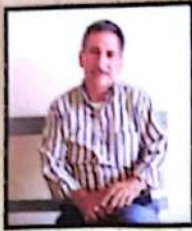
José Herminio García, Gobernador de Lempira.

"Estamos realizando la planificación a nivel departamental para quince años. Ha sido diseñado desde las bases a través de las 5 mancomunidades. En la planificación han participado los gobiernos locales, apoyados por las ONG's y otras instituciones."