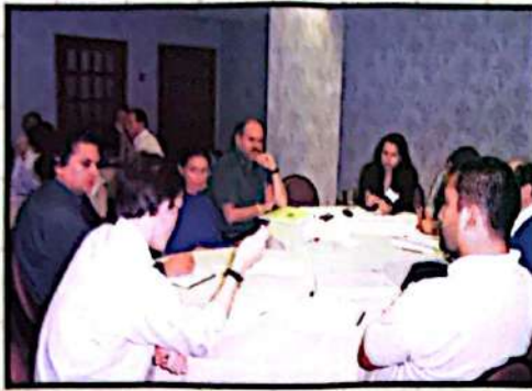
■ Primera conferencia sobre Industrias extractivas, Tegucigalpa, 2003.

1. El reconocimiento tanto de las entidades gubernamentales, centrales y locales, como de la misma compañía minera