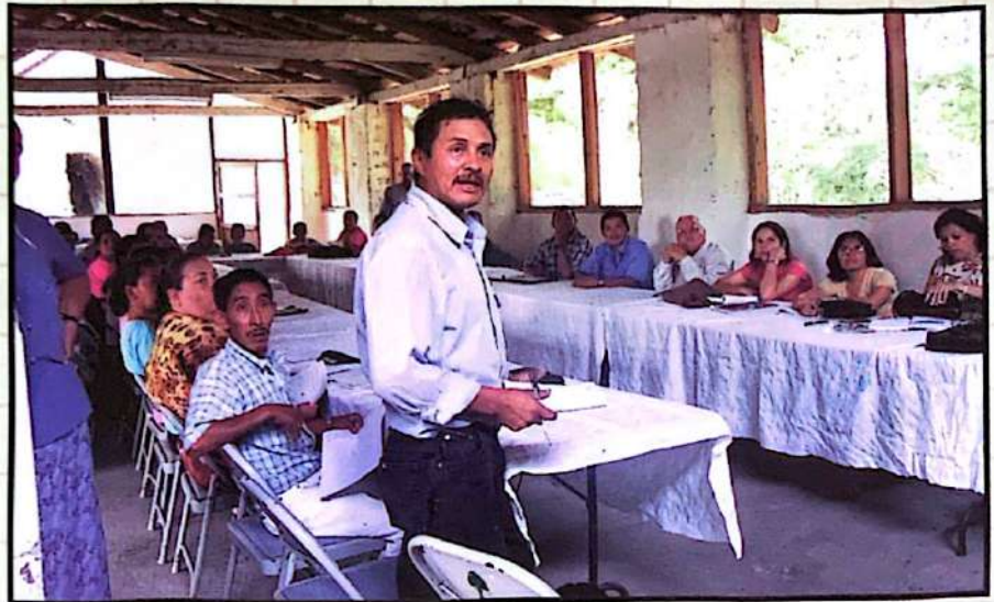
■ Réplica de taller de Escuela de Incidencia Política, El Molino, Gracias, Lempira.