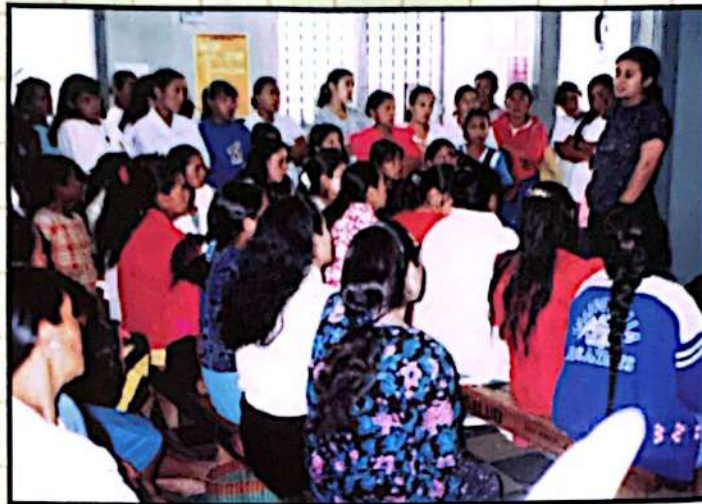
■ AIS organiza y fortalece comisiones municipales de salud.

un abordaje participativo, con acciones coordinadas de carácter interinstitucional e intersectorial, desarrollando los siguientes pasos: