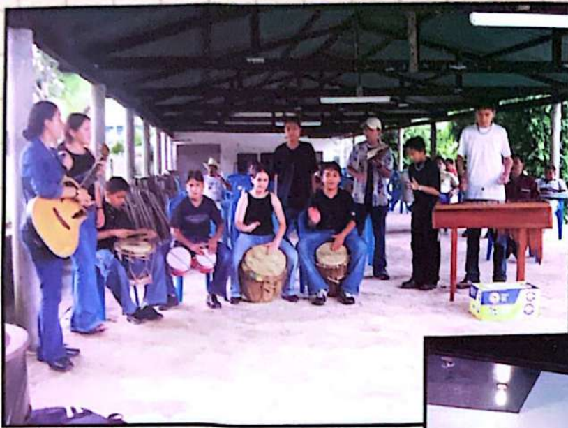
■ Presentación en Asamblea General, Asonog, 2003. Gracias, Lempira.