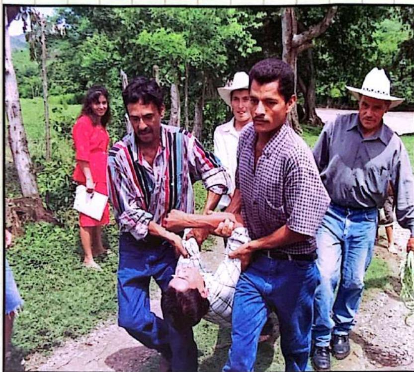
■ Simulacro en San Juan Posta, Naranjito, Santa Bárbara.

su responsabilidad, con el apoyo de ACT Honduras, facilitar el proceso de consulta a la sociedad civil, conocido como Mitch+5, el cual consiste en elaborar un informe del país a los organismos de financiamiento en donde se refleje el avance en los procesos de recuperación después del huracán Mitch.