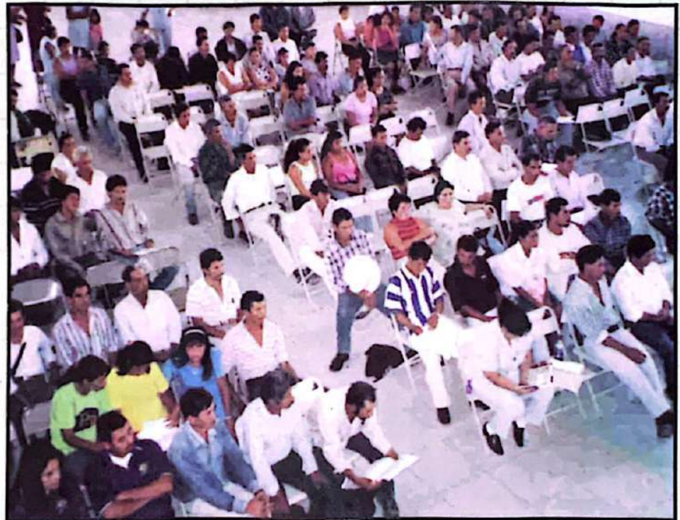
■ Cabildo Abierto en La Unión, Copán, 2003.

La Asociación de Organismos No Gubernamentales, ASONOG, fundada a finales de 1988 y con personería jurídica número 195-97, es una entidad civil de coordinación, pluralista, sin fines de lucro, con presencia en zonas fronterizas y en todo el territorio nacional. Su finalidad principal es apoyar procesos de incidencia en políticas de desarrollo del país, con la participación de los pobladores pobres y tradicionalmente excluidos, desde el