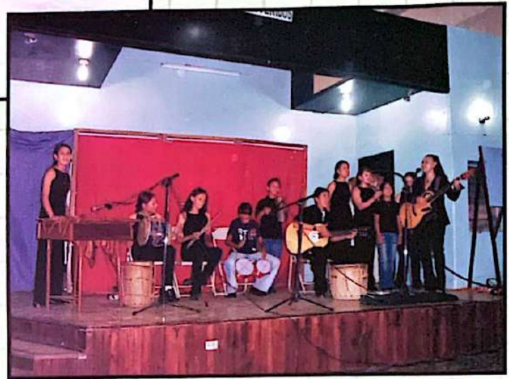
■ Noche cultural, clausura Escuela de Incidencias, 2003.