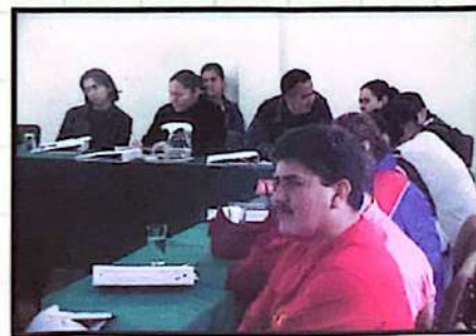
■ Escuela de Incidencia Política, Santa Rosa de Copán, 2003.