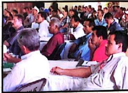
■ Foro del T.L.C., Santa Rosa de Copán, 2003.

Planificación Estratégica. Es otra de las actividades relevantes que se realiza como forma de fortalecer la gestión local que incluye acompañamiento en la parte de ejecución de los planes elaborados.